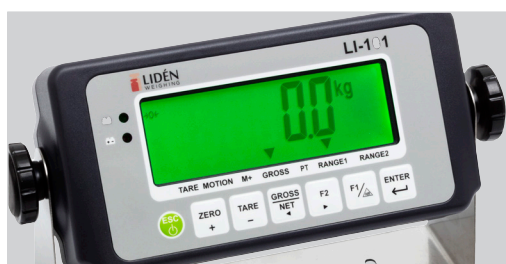
LCD display med LED bakgrundsbelysning